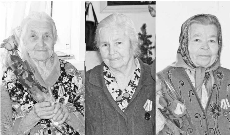
Ветераны из деревни Думиничи и деревни Поляки.

ницей на откорме, получала 800-граммовые среднесуточные привесы. Награждена медалями «За преобразование Нечерноземья» и «За доблестный труд».